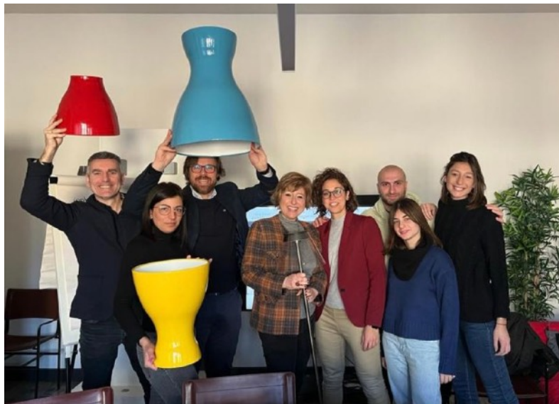
foto di gruppo alla fine di un percorso di formazione