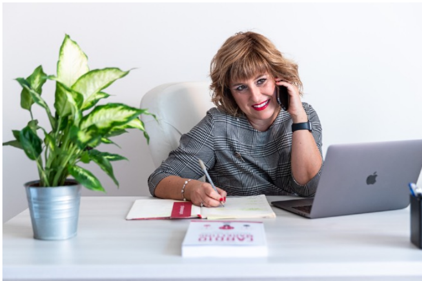
Al lavoro come strategist e project manager.