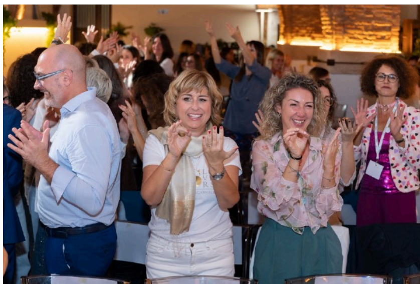
Convention nazionale dell'associazione Home Staging Lovers di cui sono formatrice e partner dal 2019.