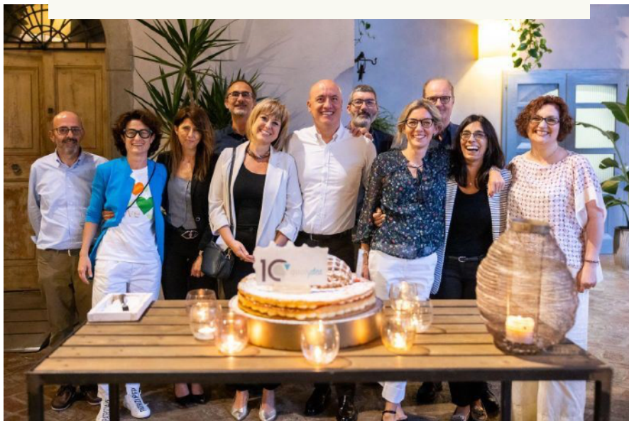
Con i partner e amici di qualydea, 2024

« La responsabilità è il prezzo della libertà. » Elbert Hubbard